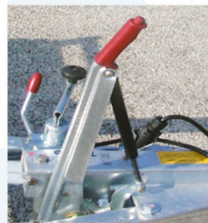
Freno di stazionamento automatico autoregistrabile con ammortizzatore a gas (di serie)