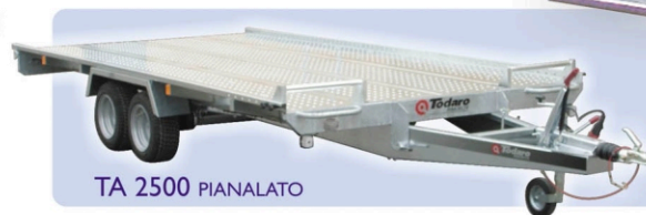
TA 2500 PIANALATO

TUTTI I MODELLI DISPONIBILI ANCHE PIANALATI -SU RICHIESTA- ALL MODELS ALSO AVAILABLE WITH CLOSED PLATFORM -ON DEMAND-